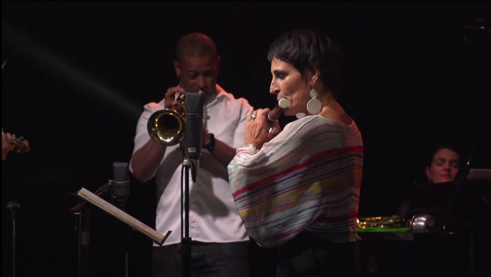
La Paloma - Sebastian Irradier